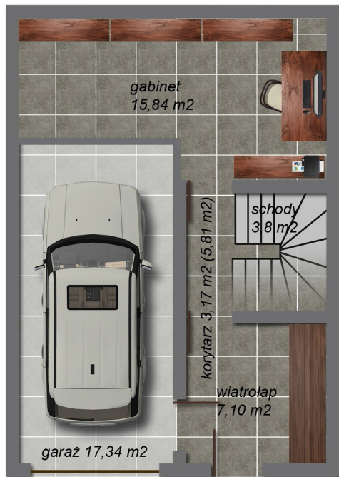
Parter 47,05 m 2 (49,69 m 2 )