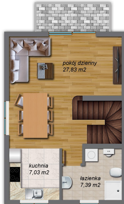
I poziom 42,94 m 2