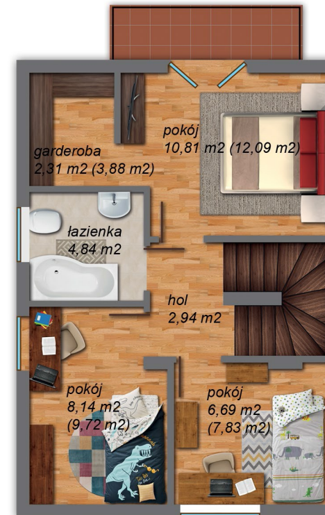
II poziom 42,94 m 2 (46,27 m 2 )