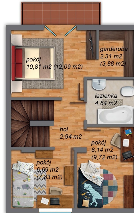
II poziom 42,94 m 2 (46,27 m 2 )