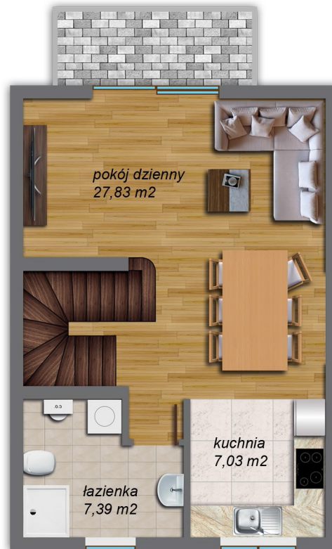
I poziom 42,94 m 2